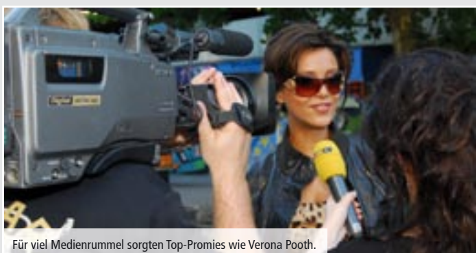
Für viel Medienrummel sorgten Top-Promies wie Verona Pooth.