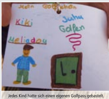
Jedes Kind hatte sich einen eigenen Golfpass gebastelt.