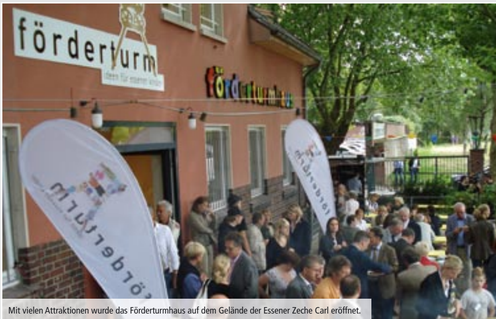
Mit vielen Attraktionen wurde das Fördererturmhaus auf dem Gelände der Essener Zeche Carl eröffnet.